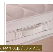
6 MANIGLIE / 3D SPACE

SANICOT è uno speciale trattamento del tessuto, assolutamente naturale, che aiuta ad eliminare acari, muffe e batteri, distruggendo le sostanze organiche che sono il nutrimento di questi parassiti. Grazie a queste caratteristiche, SANICOT risulta un valido aiuto per soggetti particolarmente allergici. SANICOT è uno speciale trattamento del tessuto, assolutamente naturale, che aiuta ad eliminare acari, muffe e batteri, distruggendo le sostanze organiche che sono il nutrimento di questi parassiti. Grazie a queste caratteristiche, SANICOT risulta un valido aiuto per soggetti particolarmente allergici.