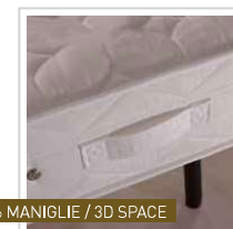
6 MANIGLIE / 3D SPACE

La schiuma poliuretana MECFOAM, elastica e anallergica, contribuisce a mantenere un microclima ideale. È prodotta con il massimo rispetto per la salute e l'ambiente in quanto priva di sostanze tossiche. Inoltre, grazie a diversi gradi di morbidezza, risponde adeguatamente alla sollecitazione del peso corporeo. La schiuma poliuretana MECFOAM, elastica e anallergica, contribuisce a mantenere un microclima ideale. È prodotta con il massimo rispetto per la salute e l'ambiente in quanto priva di sostanze tossiche. Inoltre, grazie a diversi gradi di morbidezza, risponde adeguatamente alla sollecitazione del peso corporeo.