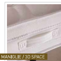
8 MANIGLIE / 3D SPACE

La schiuma viscoelastica MEMORYMEC distribuisce il peso del corpo omogeneamente, riducendo la pressione e regalando un massaggio naturale che riattiva la circolazione, lasciando riposare la struttura ossea. Inoltre regola l'umidità e mantiene costante la temperatura corporea. La schiuma viscoelastica MEMORYMEC distribuisce il peso del corpo omogeneamente, riducendo la pressione e regalando un massaggio naturale che riattiva la circolazione, lasciando riposare la struttura ossea. Inoltre regola l'umidità e mantiene costante la temperatura corporea.